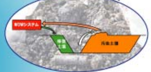
EX.4 汚染土壌浄化方式